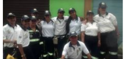
Comité Barrial de la Gestión del Riesgo de Santa Margarita en Robledo - Comuna 7